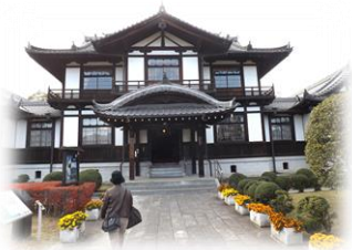
▲優美な佇まいの「今井まちなみ交流センター華蓋」

帰路は[京奈和道]をまっしぐら。午後5時40分には、無事出発地点へ到着。それぞれが沢山のお土産を抱えて家路を急いだ。（奥田・記）