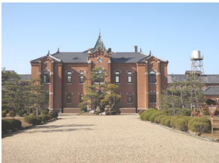
▲宮殿？いいえ 旧・奈良少年刑務所

午前8時30分集合場所の紀三井寺はやしを出発。最初の見学地・奈良少年刑務所へ西名阪路を快適に走る。車中では会話も弾み、和気あいあい。勿論、ビデオによる研修もきちんと実施しました。