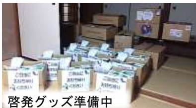
啓発グッズ準備中