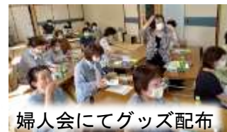
婦人会にてグッズ配布