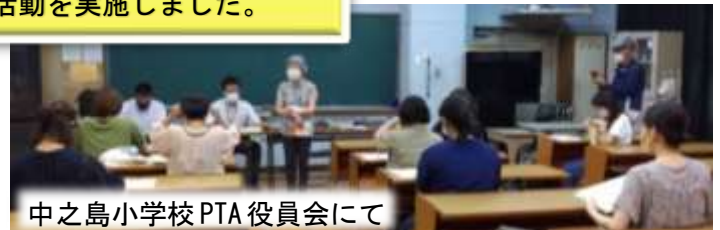
中之島小学校PTA役員会にて