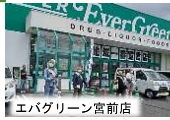
エバグリーン宮前店