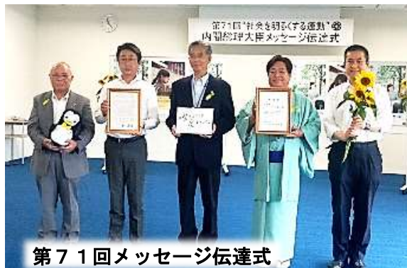
第71回メッセージ伝達式

TEL：073-460-9298 FAX：073-425-1301 Email：saposen_w@ares.eonet.ne.jp H.P：http://wahokai.sakura.ne.jp/saposen/