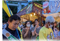
矢の宮神社夏祭り