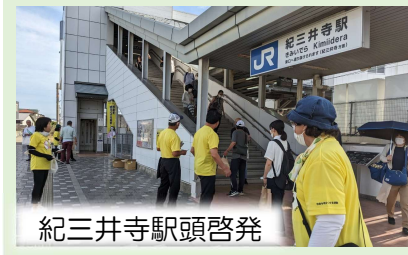
紀三井寺駅頭啓発