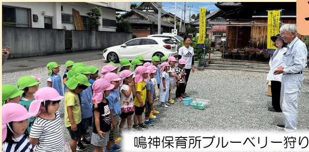
鳴神保育所ブルーベリー狩り

今年は、和歌山駅頭啓発がコロナ禍以前の形態で実行出来たので、各地域の啓発活動にも気合が入ったようです。保護司と更生保護女性会が協力し合って頑張りました。