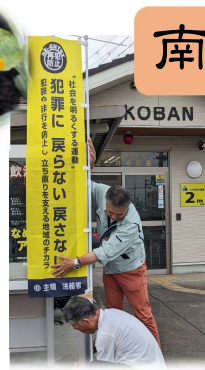
紀三井寺交番のぼり設置