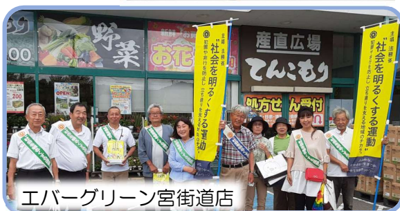
エバーグリーン宮街道店