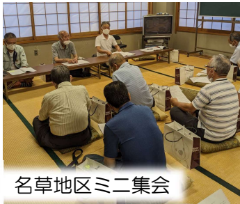
名草地区ミニ集会